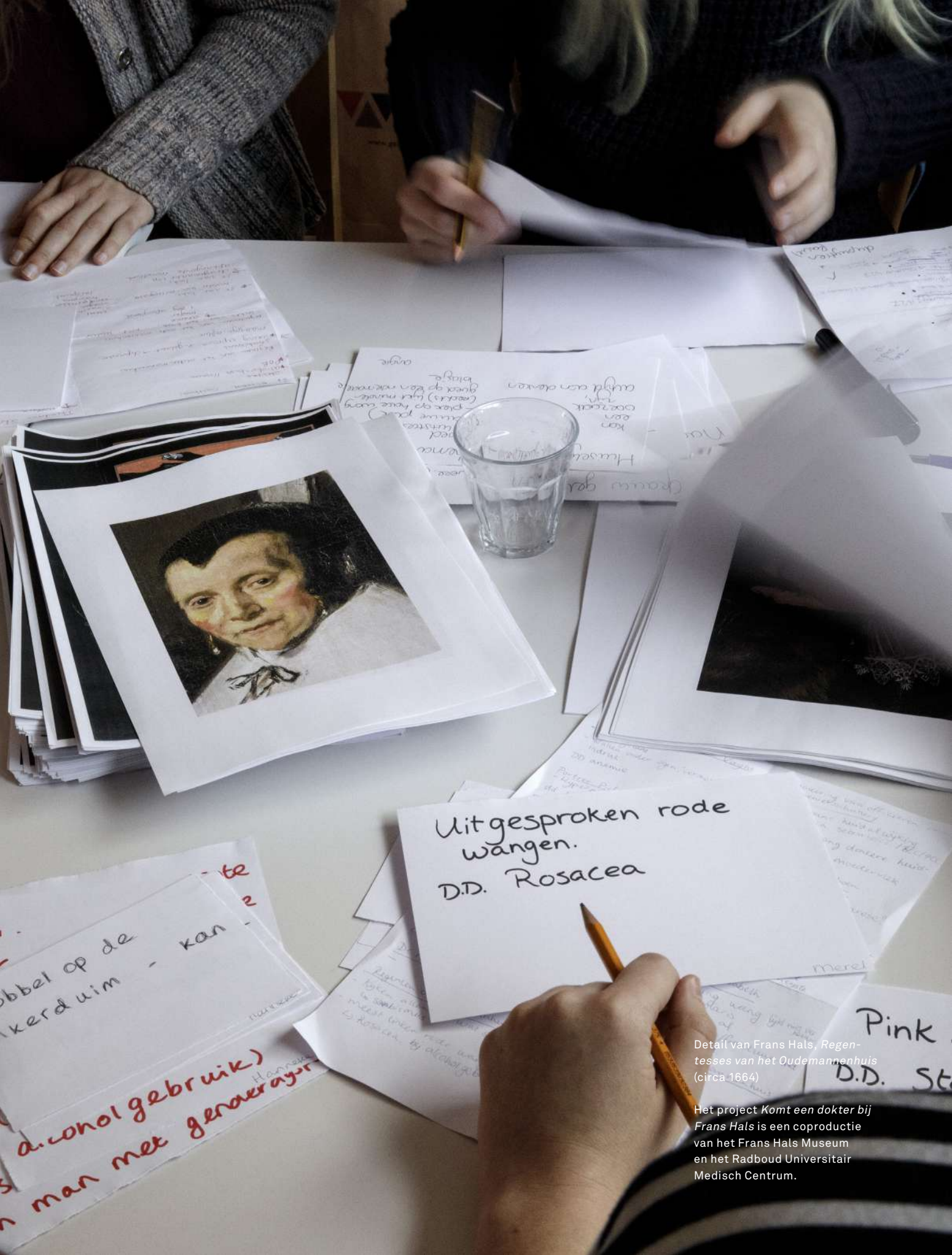
Detail van Frans Hals, Regentes van het Oudemanshuis (circa 1664)

Het project Komt een dokter bij Frans Hals is een coproductie van het Frans Hals Museum en het Radboud Universitair Medisch Centrum.