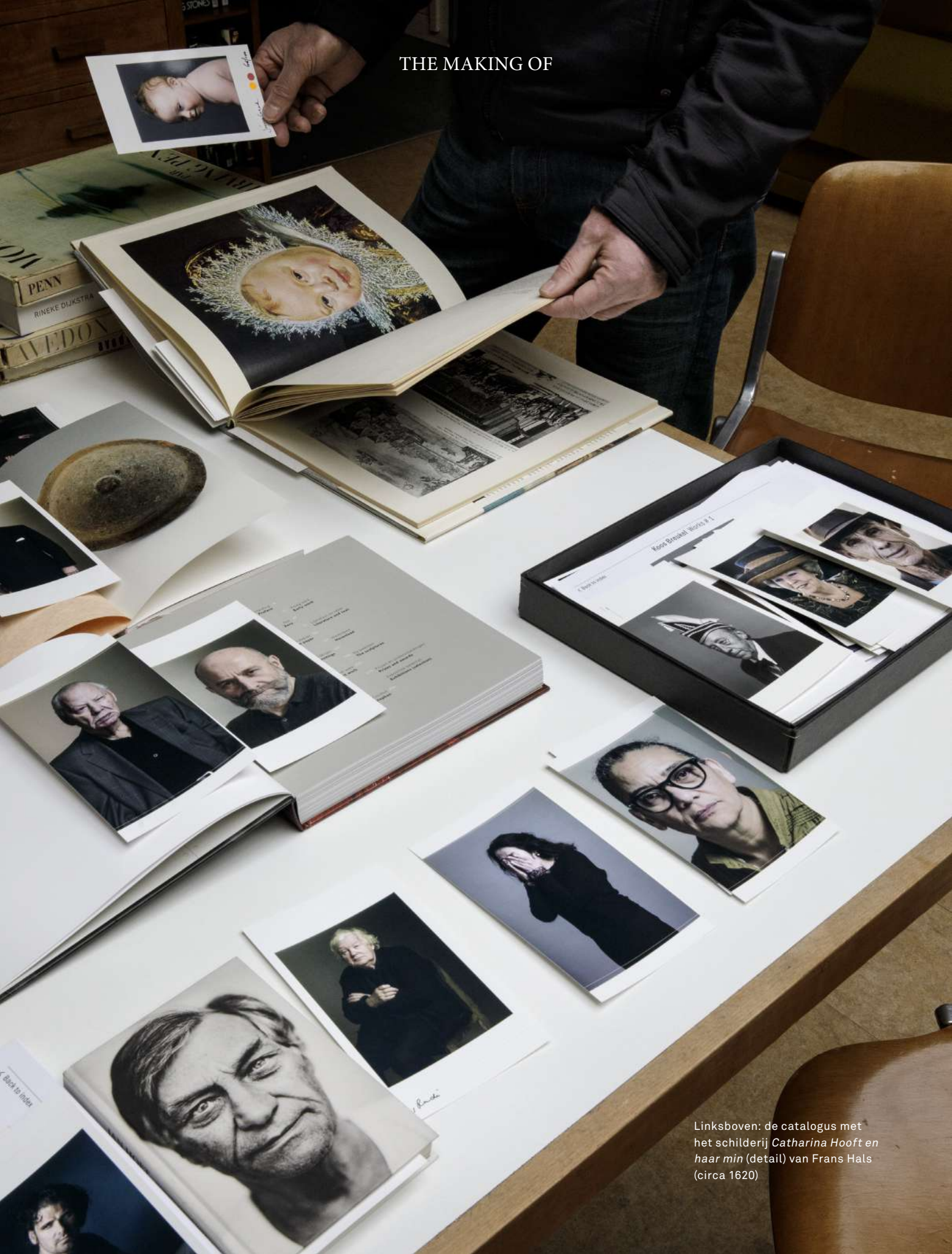
Linksboven: de catalogus met het schilderij Catharina Hooft en haar min (detail) van Frans Hals (circa 1620)