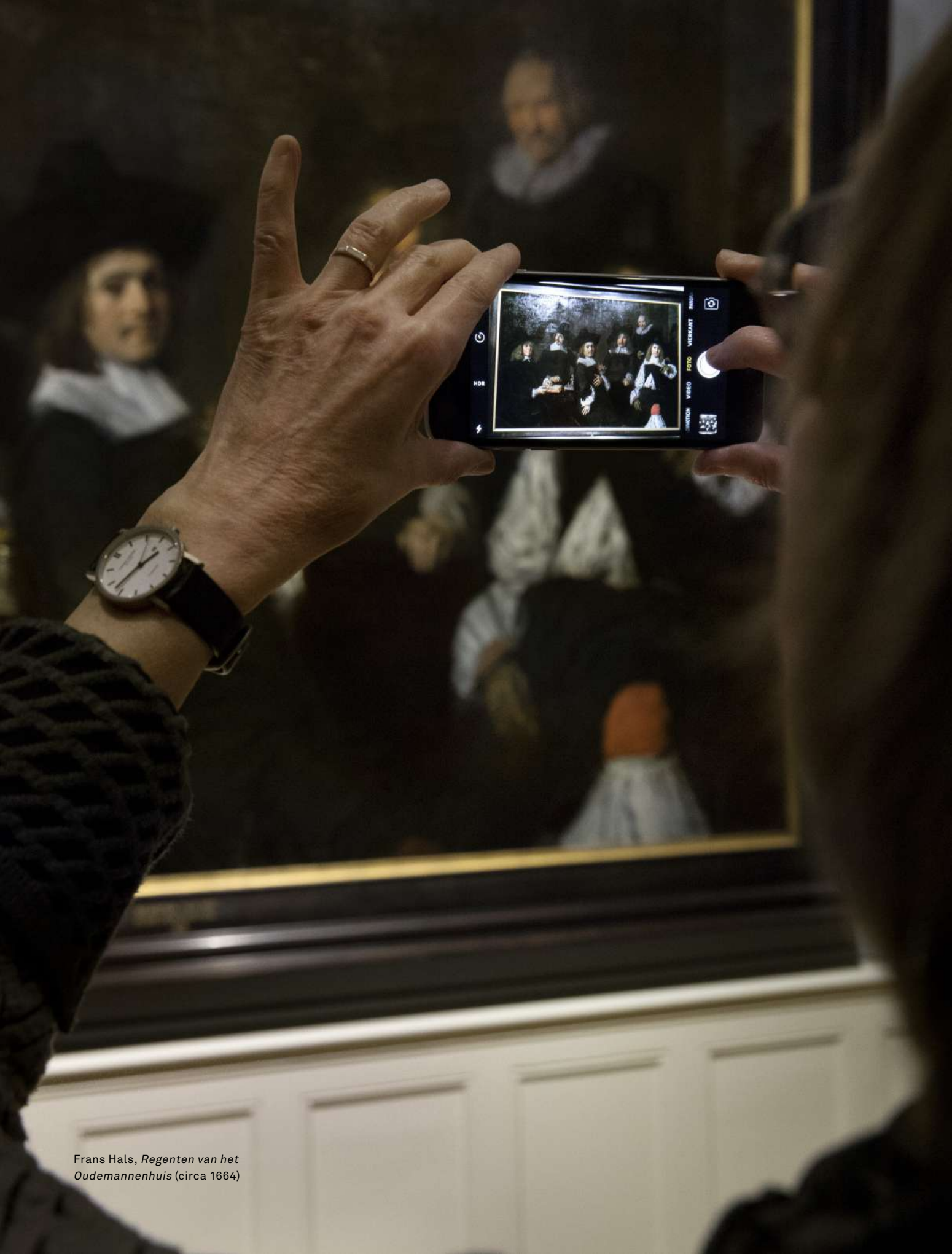
Frans Hals, Regenten van het Oudemanshuis (circa 1664)